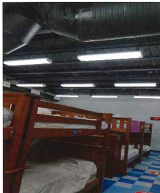
FILTRACIÓN POR CONDUCTO DE A/C