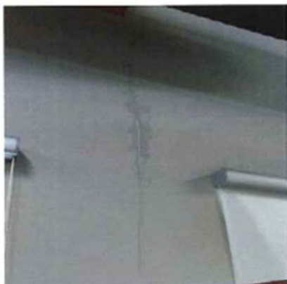
FILTRACIÓN POR PARED