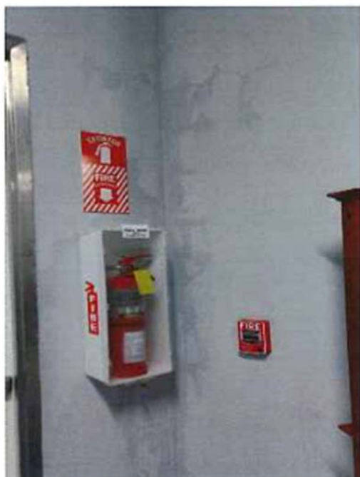
FILTRACIÓN POR PARED- ENTRADA